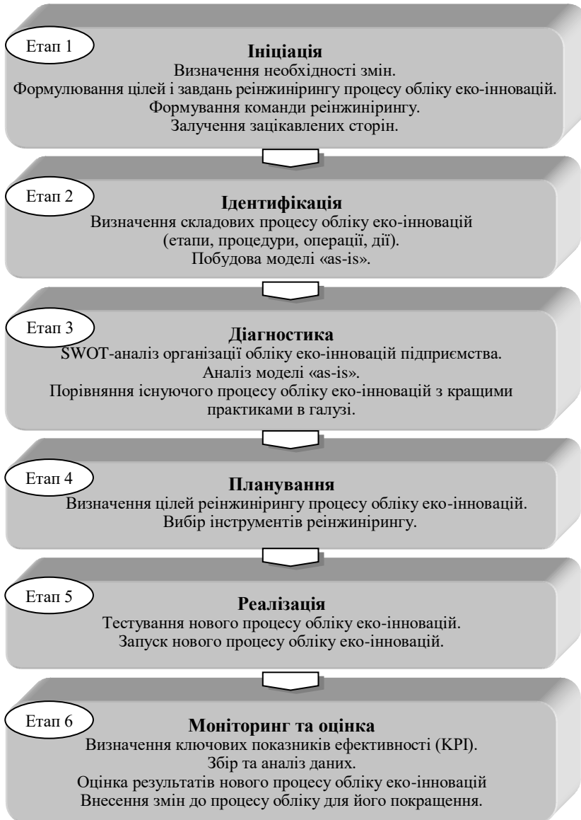
Рис. 1. Референтна модель реінжинірингу процесу обліку еко-інновацій в інформаційній системі управління підприємством, розроблено авторами на основі [7; 8]